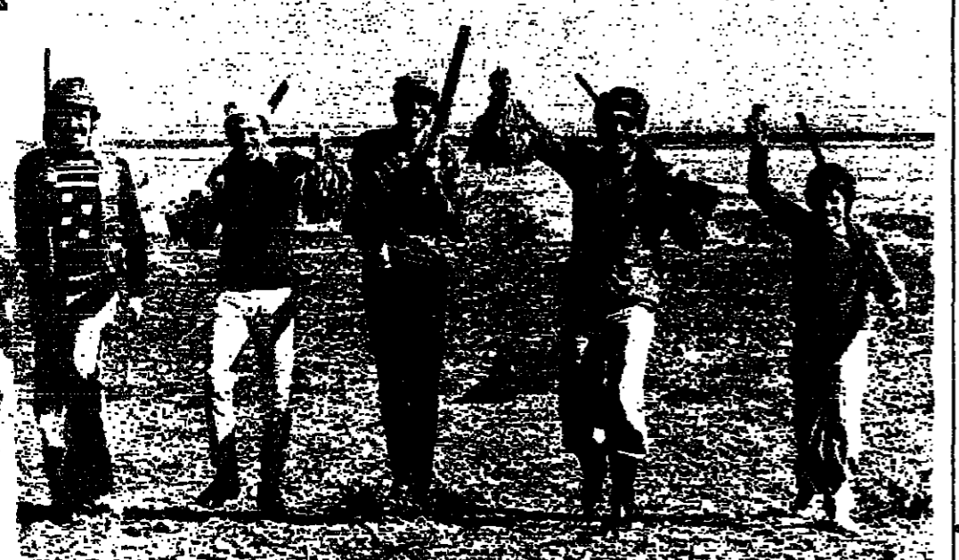
حصيلة صيد المطوق في سهل البقاع